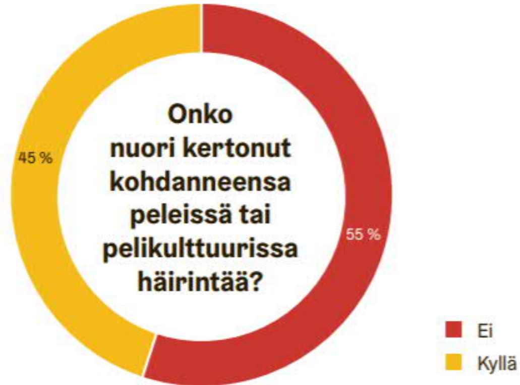
Kuvio 22. Onko nuori kertonut kohtaavansa peleissä tai pelikulttuurissa häirintää