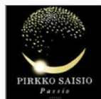
Passio Pirkko Saisio E-äänikirja - Varattavissa