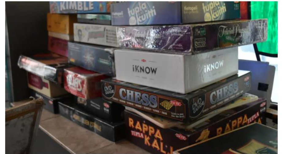
Suomalaiset istuvat mielellään iltaa lautapelin ääressä, vaikka ne välillä kuumentavatkin tunteita. Porilaisen pubin valikoimassa on parikymmentä peliä.

Jos pelisi päättyvät turhan usein riitaan, kannattaa miettiä, onko syy pelissä vai pelaajassa. Pelillistämisen professori Juho Hamari tarjoaa kuumakalleille muutaman varteenotettavan vinkin.